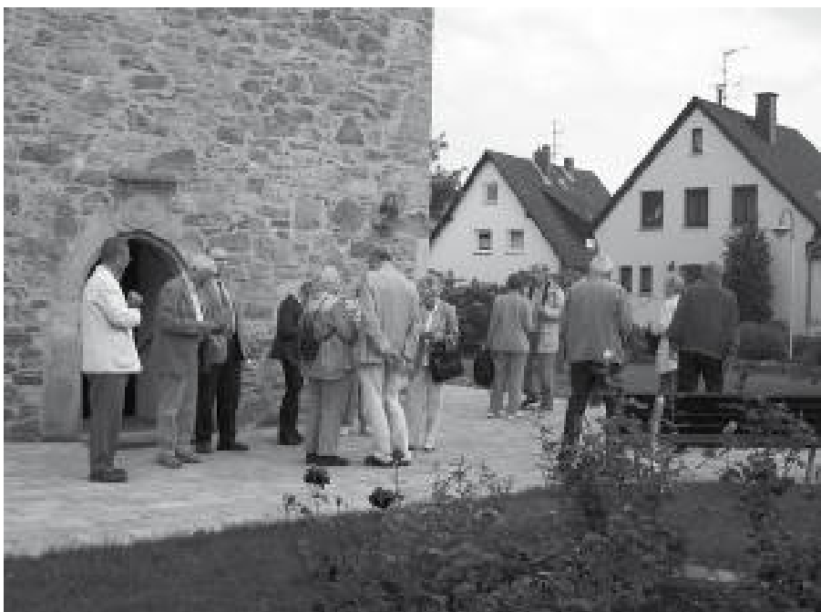
Nach der Abendandacht in Großwieden