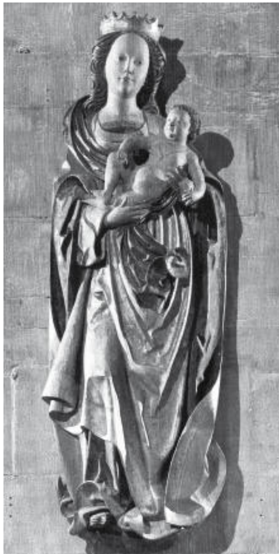
sog. Osnabrücker Meister: Madonna mit Kind auf der Mondsichel um 1520 Holzschnitzfigur an der rechten Chorsäule von St. Marien