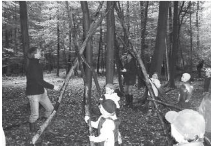
Tipi-Bau mit vereinten Kräften