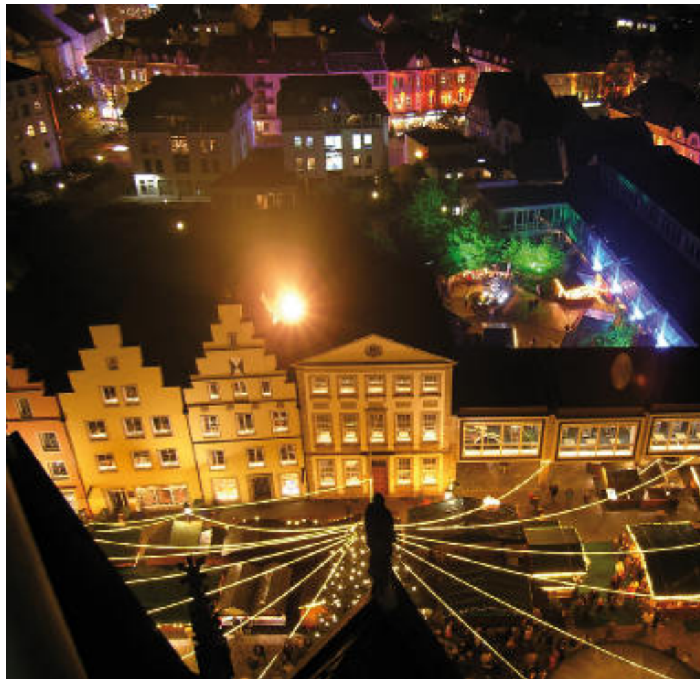
Markt in vorweihnachtlicher Beleuchtung Aufnahme vom Kirchturm: Tilo Gliesche